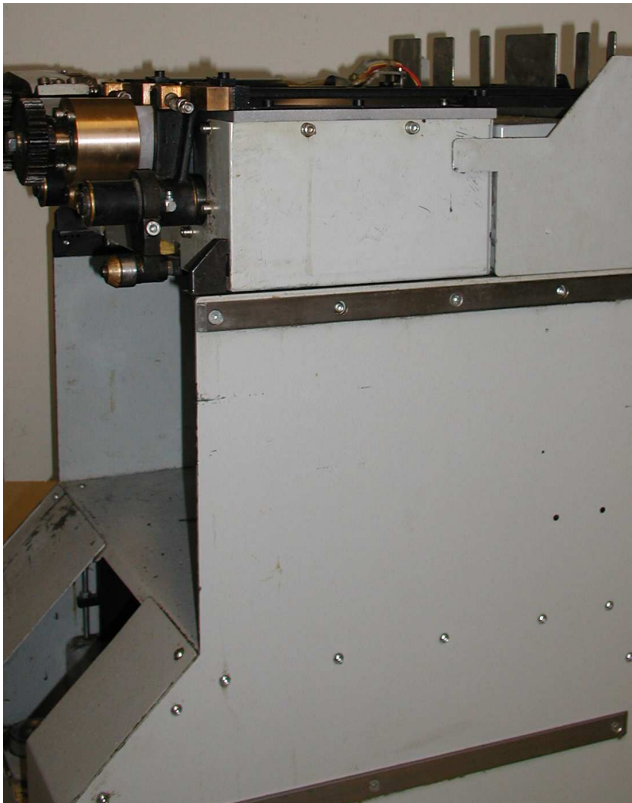
Komplettüberholung einer Klebebinder - Rückenbeleimungsstation